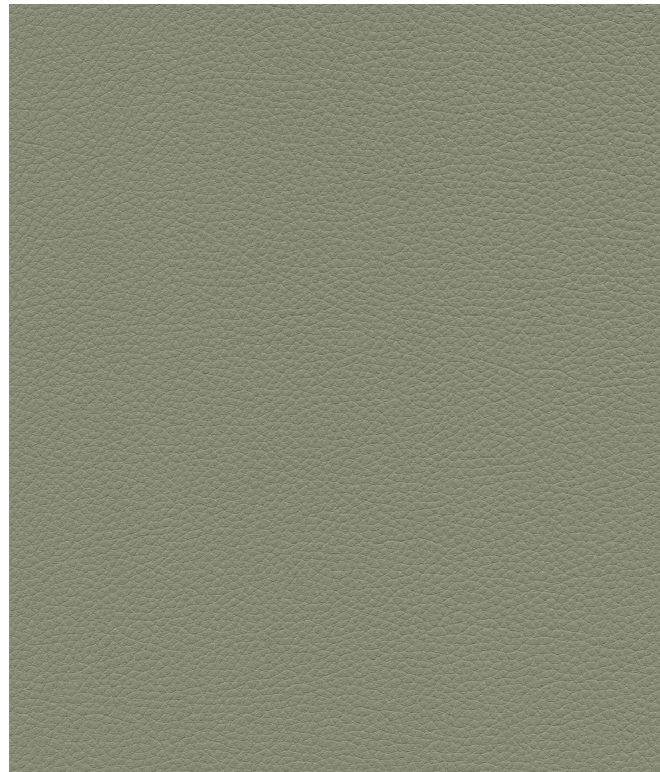
skai® Toronto EN staynu organic green F6471080

Material de tapicería de alta calidad de skai® para diversas aplicaciones, especialmente en el sector de las áreas públicas. Su grano de cuero clásico realza el mobiliario y las paredes. Gracias al innovador acabado con la tecnología skai® staynu, el material es muy resistente a las manchas y muy fácil de limpiar. Esto mantiene su aspecto visual como el primer día durante mucho tiempo, sin importar lo que pase.